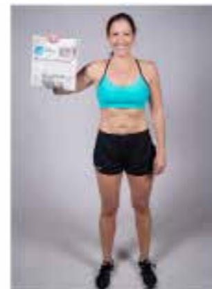
正面 (手拿當天報紙或有日期顯示)

1. 穿著合身的運動服裝。如果您可以接受，建議男性可以裸露上身，女性則可以穿著一件半身的運動型內衣。